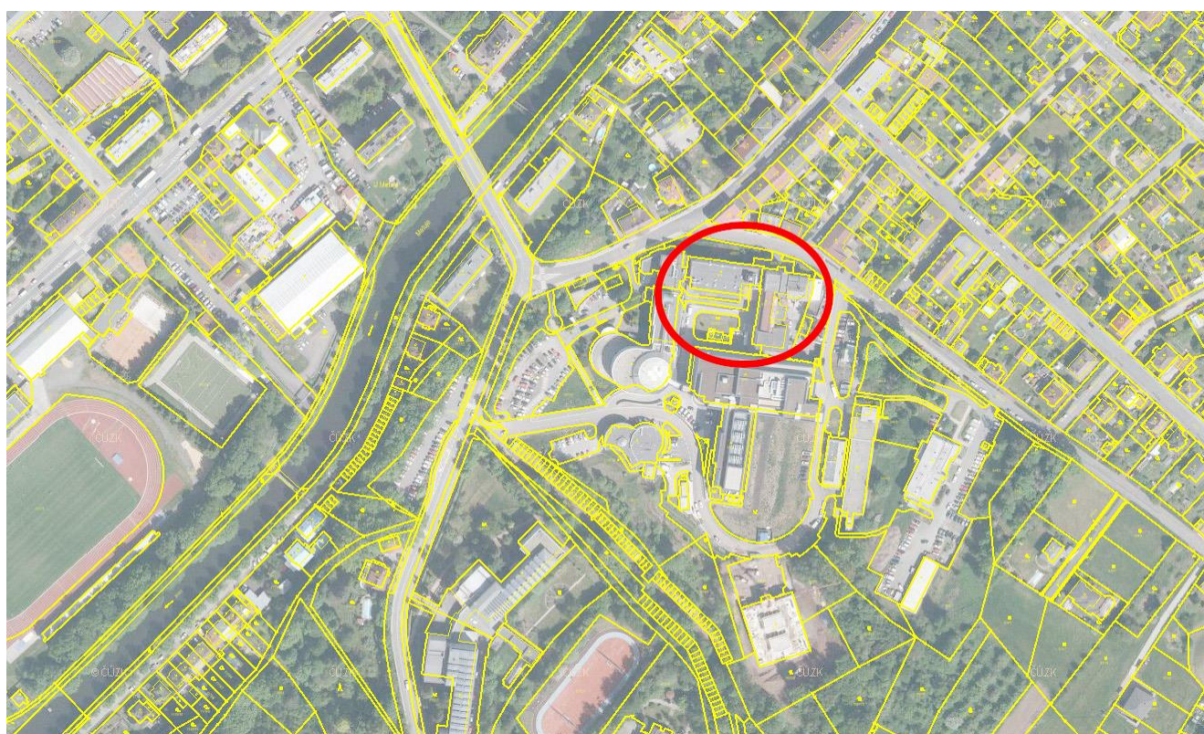
Obrázek 2: Celková situace areálu s katastrem nemovitostí - stávající stav (zdroj ČÚZK, http://nahlizeniidokn.cuzk.cz/ )